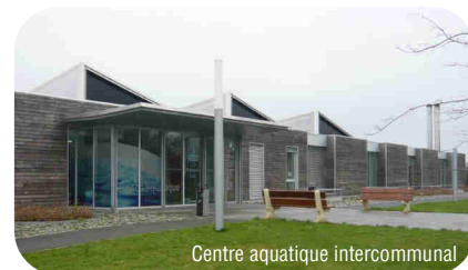
Centre aquatique intercommunal

Morlaix Communauté soutient la filière en s'approvisionnant auprès de la SCIC, pour alimenter la chaudière du centre aquatique.